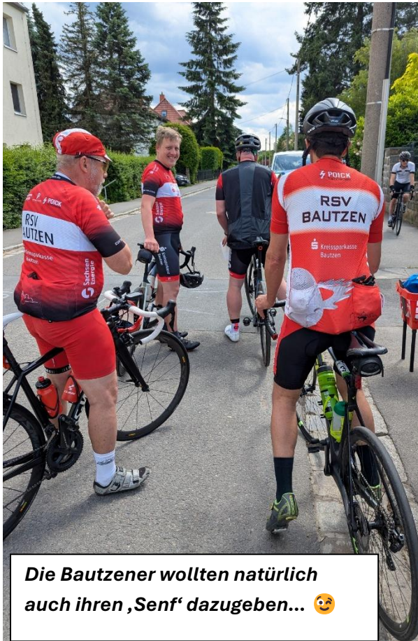
Die Bautzener wollten natürlich auch ihren ‚Senf‘ dazugeben... 🤪