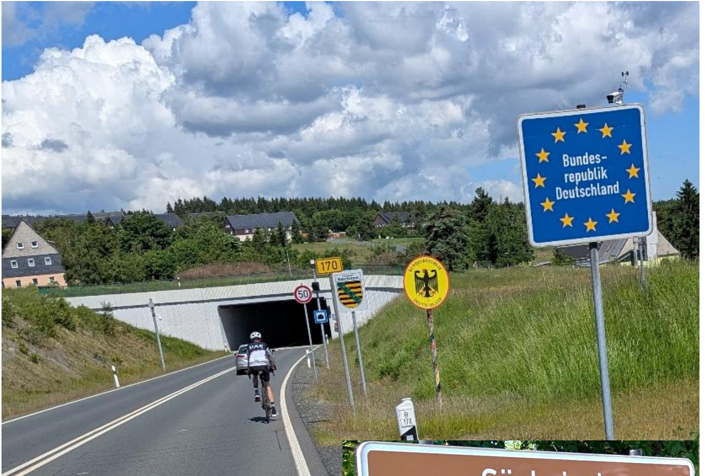
Grenzübergang Cinovec / Zinnwald