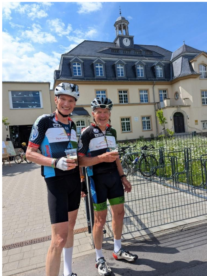
glücklich strahlende Cottbuser Stammgäste