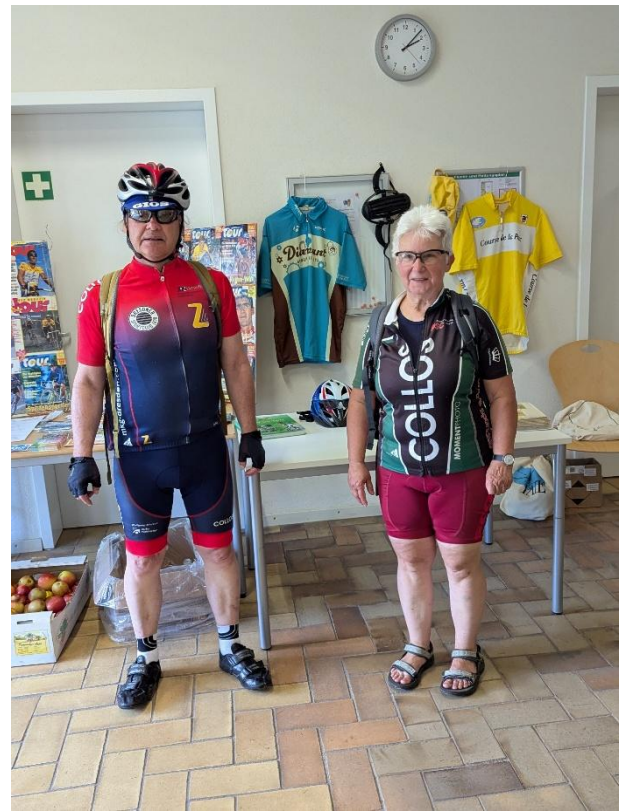
Interessante Info-Stände im Anmelde-Org. Bereich, auch zur Friedensfahrt und Ernährung