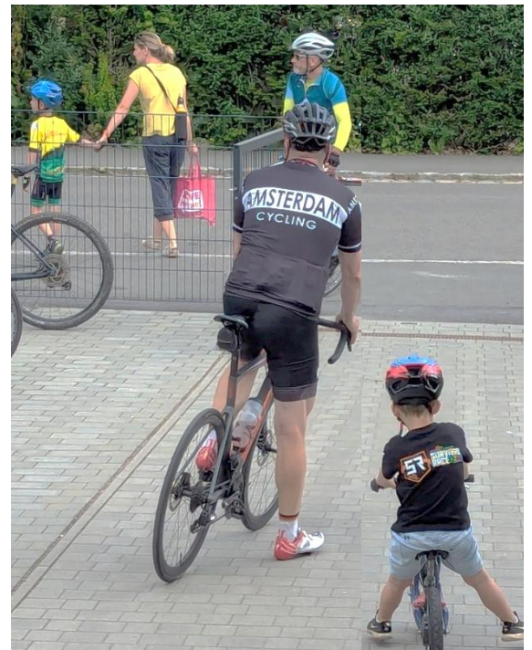
Klein-Mäxchen: „Papa, ich werde bestimmt auch mal ein großer Radrenner. Aber warte, gleich gewinne ich die Kleine Friedensfahrt...“