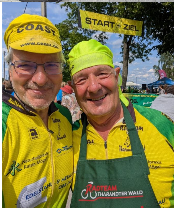
Wiedersehensfreude nach 5 Jahren