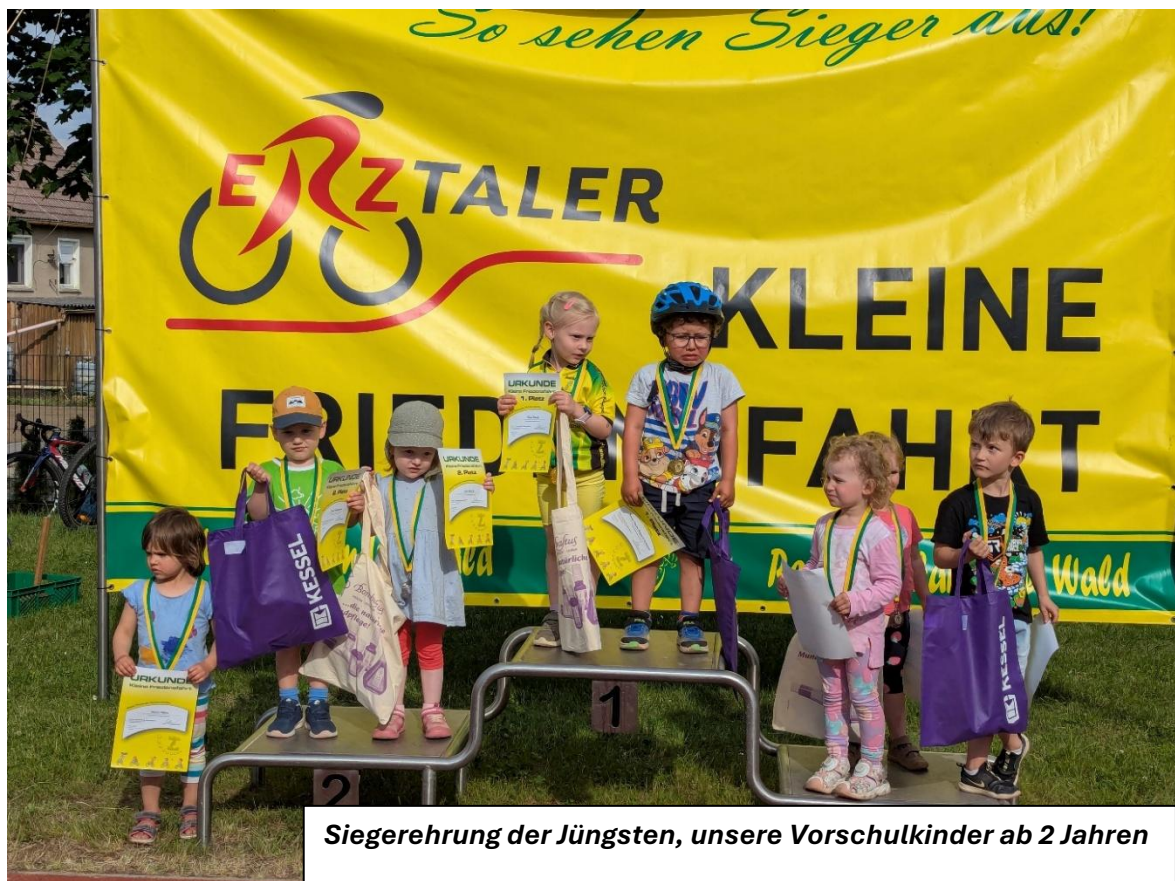
Siegerehrung der Jüngsten, unsere Vorschulkinder ab 2 Jahren