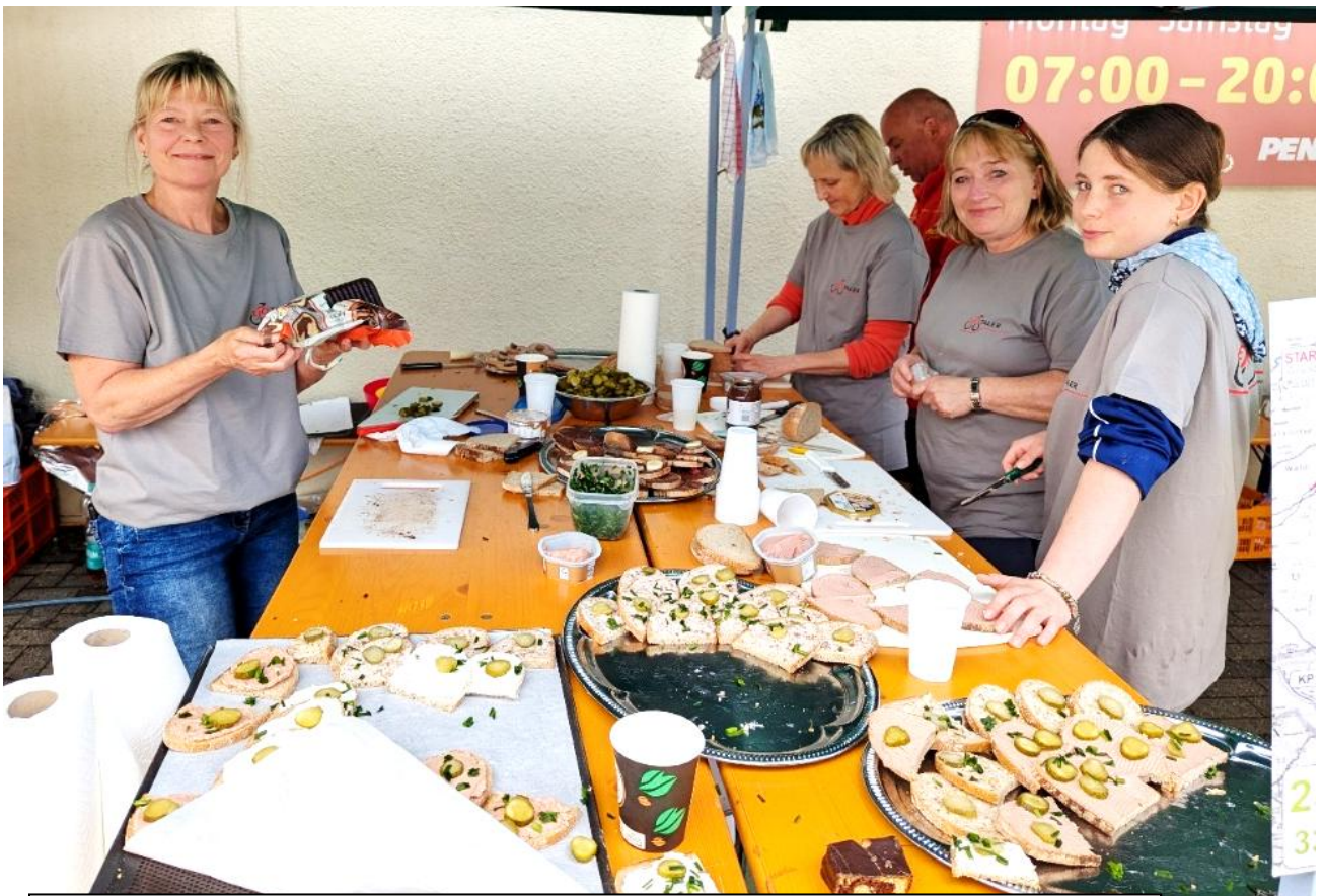
Wie die Verpflegung, so die Bewegung... und das wurde durch stets charmantes Lächeln der RTTW-RTF-Helfer noch getoppt... 😊